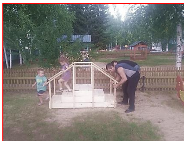
Зона успешного развития